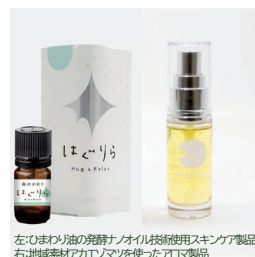
左:みまわり油の発酵ナノオイル技術使用スキンケア製品 右:地域素材アカエノマツを使ったアロマ製品

【支援実績例】地域産品(木工・金属加工・食品)コラボレーション製品の開発に係る支援、バス乗換案内webサービスの開発に係る支援、機械装置等の開発プロジェクト支援等。